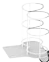
Giá đựng bình Oxy (WLB-1060)