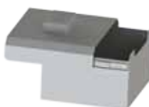
Ngăn Kéo (WLB-1050)