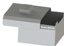
Cajón de almacenamiento (WLB-1050)