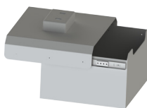
Cajón de almacenamiento (WLB-1050)